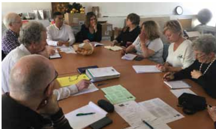
Une séance du Conseil d'Administration (CA)